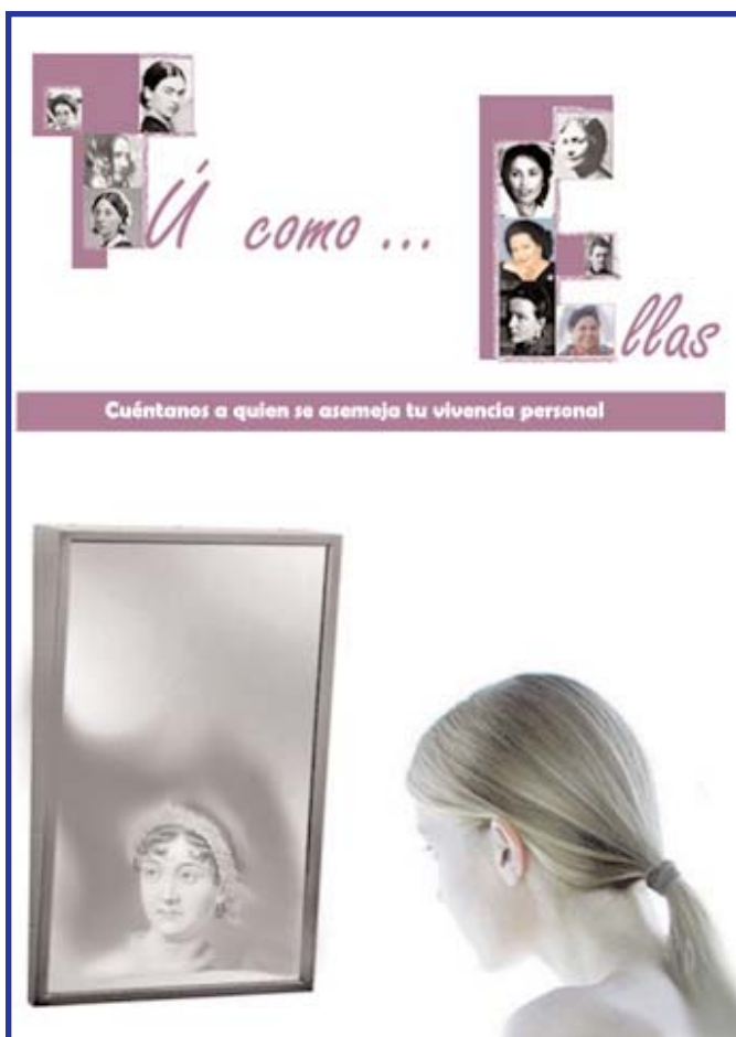
Cartel de la campaña "Tú como ellas" para rendir homenaje a la mujer de ayer y hoy.

Esta propuesta está triunfando en la web social, donde ya cientos de usuarios han cambiado su foto de perfil. Y además se convirtió en la noticia más votada del día en la web líder de información del Tercer Sector, canalsolidario.org .