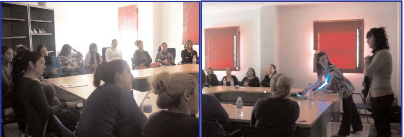
Las mujeres del proyecto de Acompañamiento socio-laboral durante la charla de nutrición, en Moratalaz.

La entidad considera que este tipo de formación debe ser parte de los itinerarios de acompañamiento social, en los que se abarcan temas que va desde la sexualidad hasta la nutrición, ya que la salud y su promoción es prioritaria.