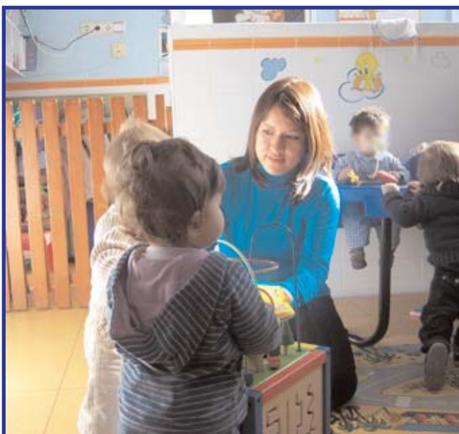
Alumna de prácticas en guardería de Arganzuela.