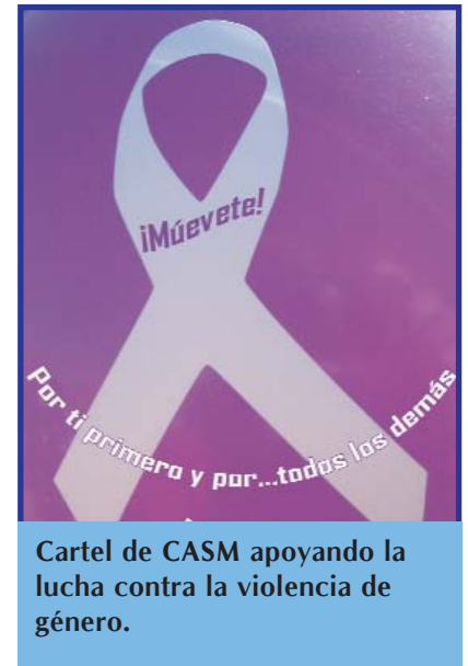
Cartel de CASM apoyando la lucha contra la violencia de género.

Una vez más, Celia se despertó sobresaltada, por los gritos de papá y mamá. Los ruidos venían del salón, donde los dos discutían acaloradamente.