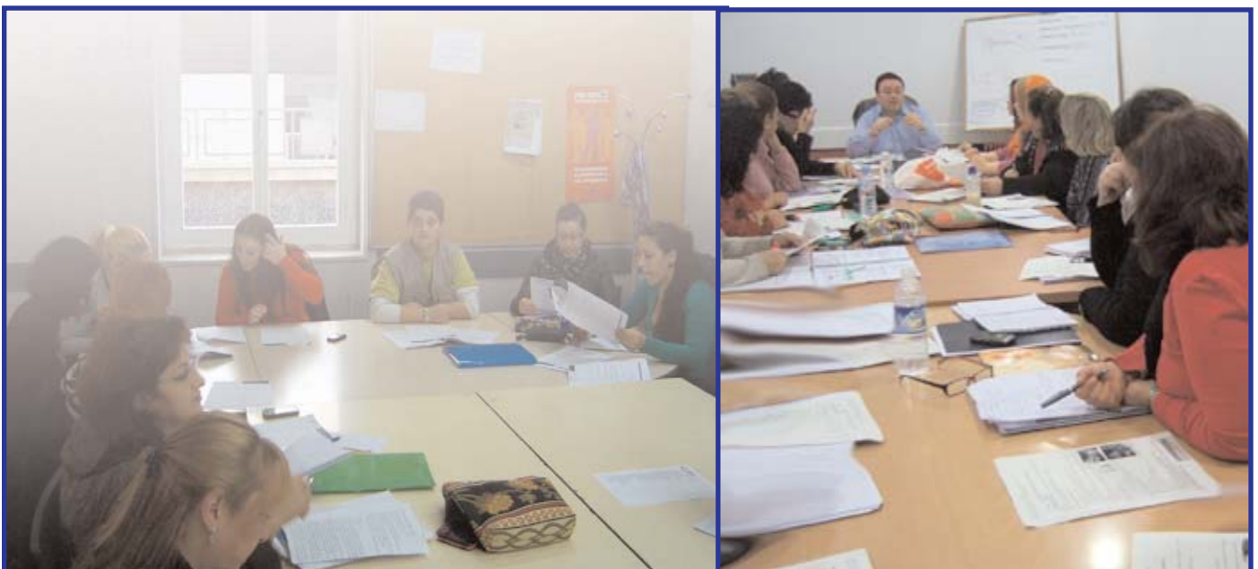
A la izquierda, alumnas del formativo ocupacional de CASM de Auxiliar de Jardín de Infancia - en Vallecas-, en su primera edición. A la derecha, los alumnos del formativo de Auxiliar de Geriatria y Dependencia - en Arganzuela-, durante una de las clases; de ellos ya han encontrado empleo seis.

Tienen una duración aproximada de tres meses e incluyen prácticas en centros homologados. Estos formativos son gratuitos, abiertos a todo el mundo - en su mayoría desempleados o personas en riesgo de exclusión social- y forman parte del programa de CASM de Apoyo y Acompañamiento Socio-laboral . Han contado con la financiación del Ayuntamiento de Madrid y de Caja Madrid.