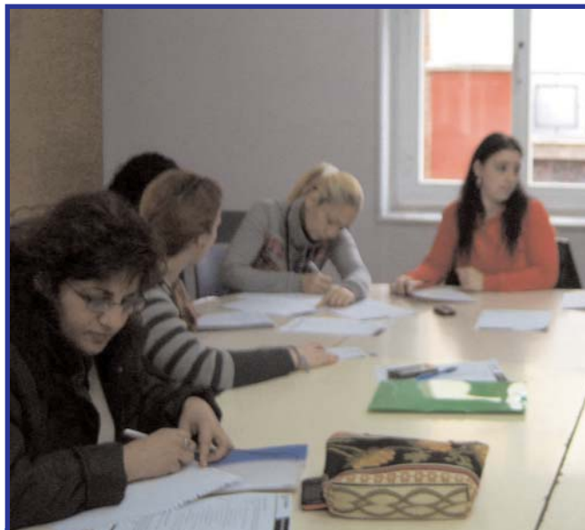
El 30% de los usuarios encuentran empleo.

En los próximos meses, la entidad seguirá su trabajo con los grupos de Animación y Educación de mujeres adultas, así como con los programas de Acompañamiento socio-laboral en Villaverde, Puente de Vallecas y Moratalaz. Y en septiembre se reanudarán los formativos en Auxiliar de Geriatría y Dependencia y Limpieza Industrial , cursos en los que ya hay lista de espera. En función de la demanda y el apoyo a proyectos se podrá ampliar el número de ocupacionales.