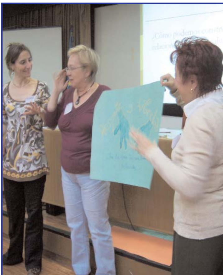
Presentación de la propuesta final de los grupos CASM, acerca de la relación de pareja perfecta.

El fin de la fiesta era recaudar dinero, que este año será destinado en su totalidad a las Hermanas Combonianas. La entrega se hará el próximo 9 de junio.