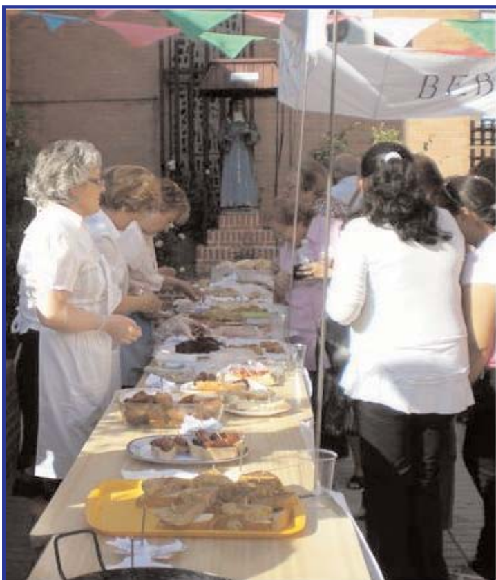
Barra de comida y bebidas en la Fiesta de la Solidaridad, todo organizado y servido por las usuarias de Velázquez.