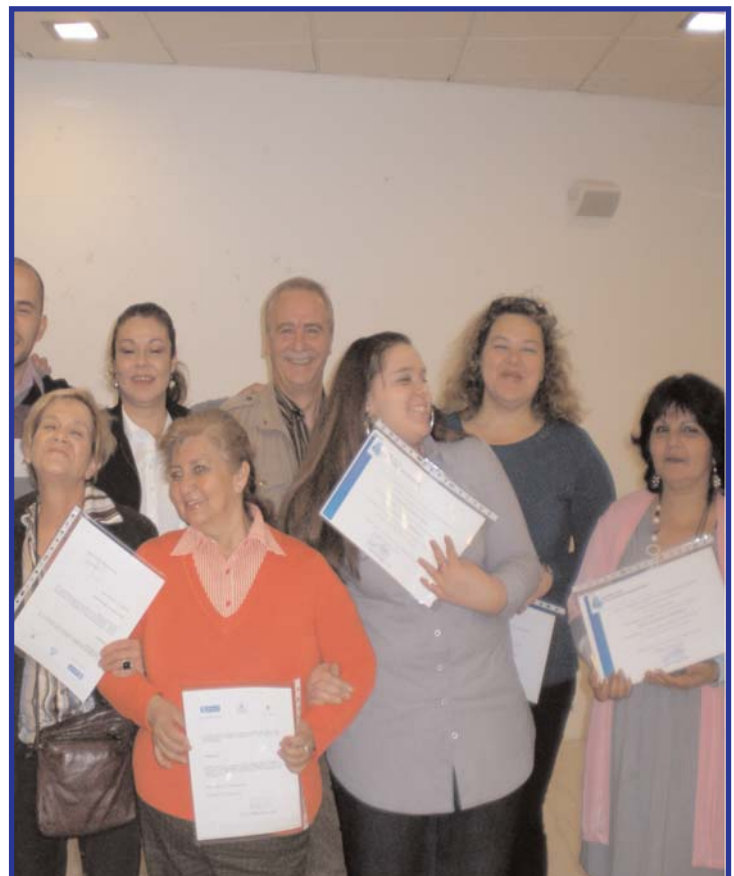
Algunos de los alumnos que han cursado el formativo gratuito en Auxiliar de Geriatria. Enhorabuena!

Asimismo, CASM ha mostrado su satisfacción al comprobar que el 55% de los alumnos de esta edición ya han encontrado empleo.