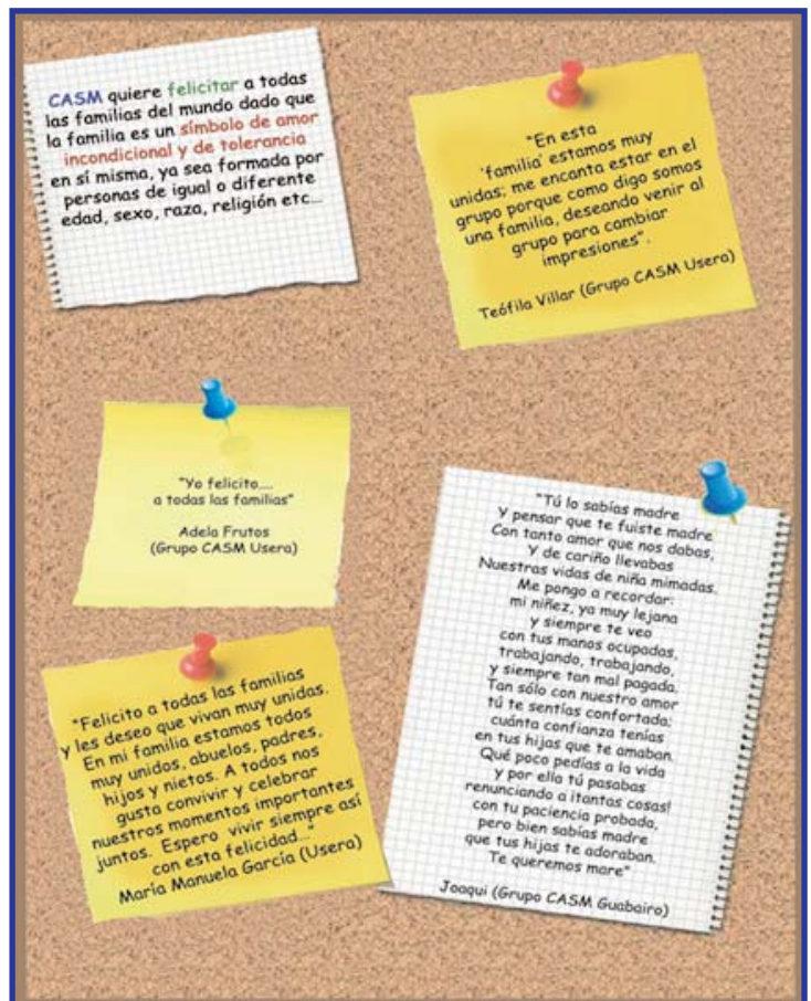
Felicitaciones de beneficiarias de los grupos CASM de Guabairo y Usera publicados en la web.

Además envió una carta a la Ministra de Igualdad para pedirle que aplique medidas de control efectivas para que las empresas cumplan con el Plan de Conciliación Familiar y Laboral. La Ministra respondió a CASM - vía telefónica-, diciendo que apoyaba y estimulaba nuestro trabajo por lograr la Conciliación, y aprovechó para felicitar a CASM por el trabajo que viene realizando, "muy especialmente con las mujeres inmigrantes, quienes se encuentran a veces tan desprotegidas".