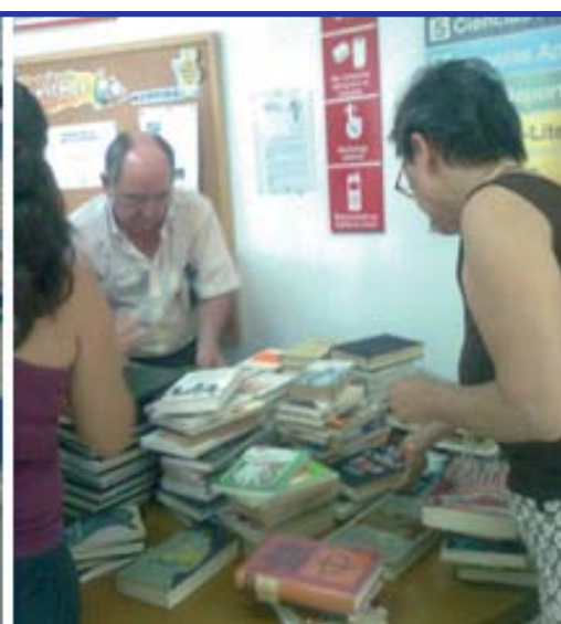
Izquierda, trabajadoras de CASM escribiendo mensaje de la entidad en los libros donados. Derecha, libros en Punto de Encuentro de la Biblioteca, donde varios usuarios estaban consultándolos.