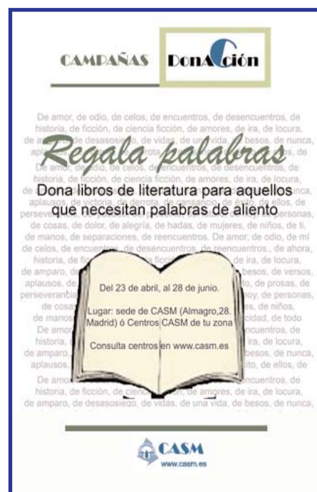
Cartel de la campaña CASM "DonaAcción", Regala palabras.

Biblioteca Pública del Estado en Madrid, C/Azcona nº42.