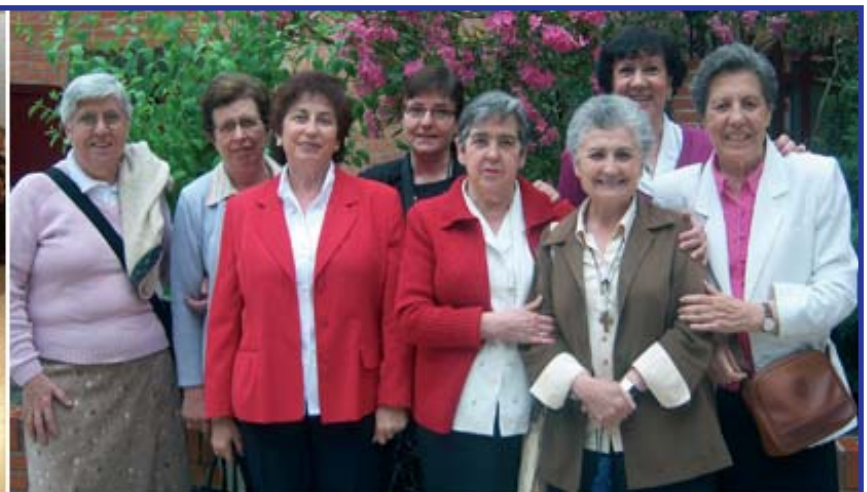
A la izquierda, usuarias de CASM que asistieron al evento. A la derecha, las animadoras y monitoras de CASM de Velázquez junto a las Hermanas Combonianas.