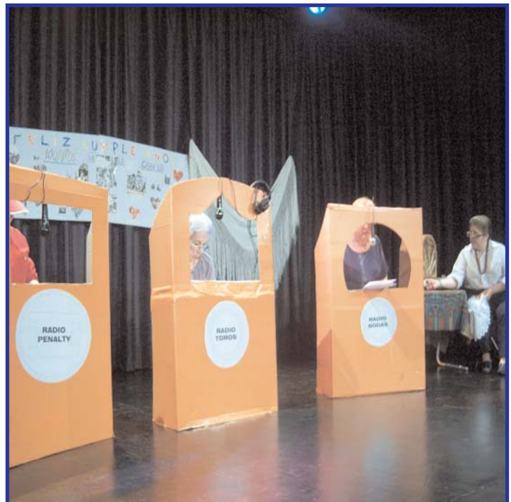
Fiesta fin de curso del grupo Lacoma, donde las usuarias organizaron diferentes actividades lúdicas. Entre ellas algunas acciones, de escenificaciones cómicas - como en la fotografía-

Para despedir el curso durante el periodo estival de verano con buen sabor, cada centro ha hecho su propia fiesta, donde como es habitual las usuarias se implican en todas las actividades.